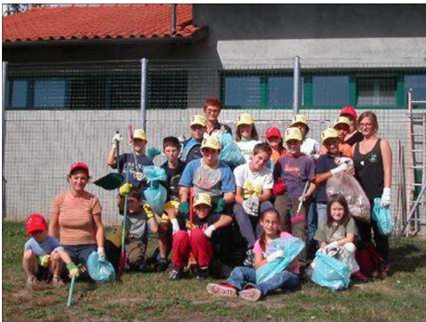
25 Settembre –Puliamo il Mondo a Colletterto Giacosa

Due gruppi, composti principalmente da adulti, hanno ripulito da rovi e sterpaglie sia la zona adiacente alla Cappella di Santa Liberata che un tratto del letto del Rio Valassa.